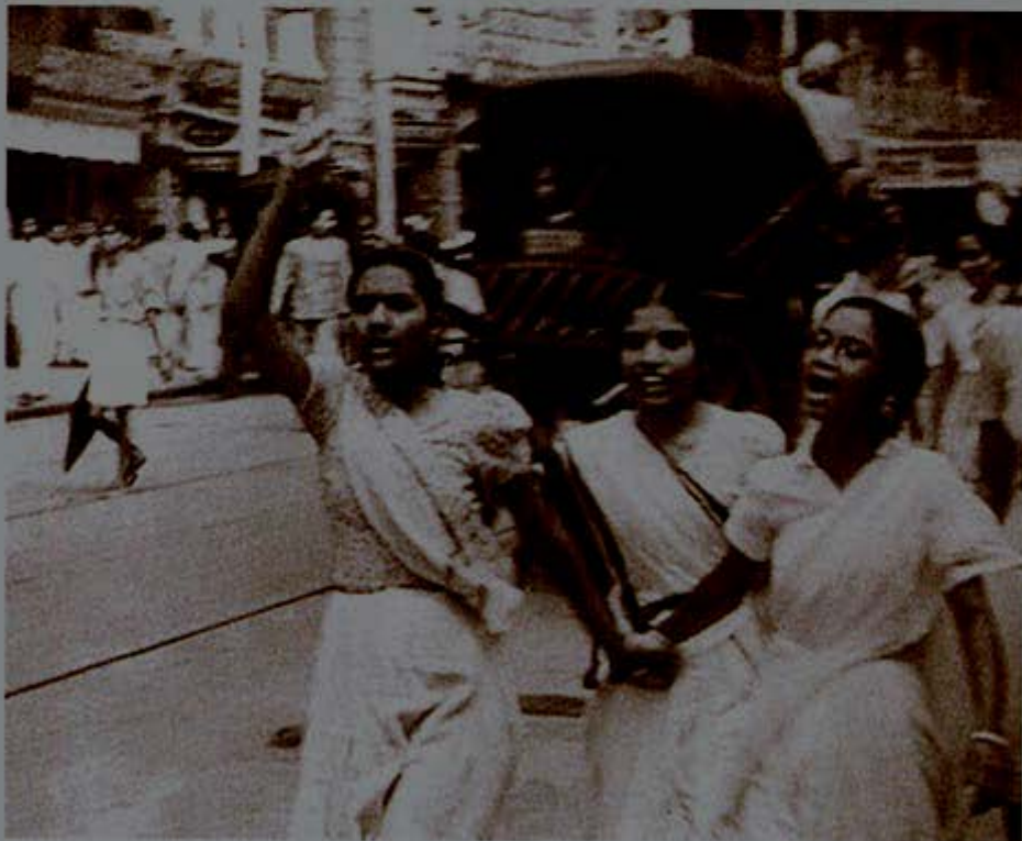
Gandhi Heritage Portal Demonstrations during the Quit India Movement, 1942